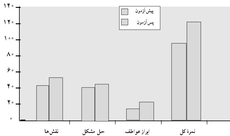
نمودار ۲- میانگین تفاوت‌های پیش آزمون و پس آزمون «ساخت خانواده» برای گروه مادران

جدول ۴ و نمودار ۲ نتایج آزمون t برای مقایسه میانگین تفاوت‌های نمرات پیش آزمون-پس آزمون را در گروه مادران نشان می‌دهد. مقادیر t محاسبه شده برای نمره کل آزمون و سه خرده - مقیاس آن در سطح p < 0/0001 معنادار است (مقدار بحرانی: t = 4/13 و df = 12 و \alpha = 0/0005 ). بنابراین مداخلات درمانی منجر به بهبود ساخت خانواده و عملکرد مادران در سازه‌های «نقش‌ها»، «حل مشکل» و «ابراز عواطف» گردیده است.